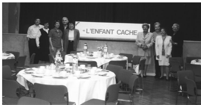
L'équipe dévouée des membres du Comité se prépare à accueillir les invités après la mise en place de la salle.

Ce jour-là, une tempête s'abattit sur Bruxelles, ce jour-là, le circuit des 20 kms de Bruxelles a barré maintes routes. Mais il fallait plus que cela pour décourager nos membres. Le café klatsch a réuni bon nombre de nos amis, ravis de se retrouver et de déguster les pâtisseries "maison" dans une ambiance "heimish" comme d'habitude.