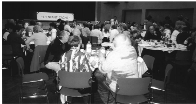
"Café Klatsch" du 28 mai 2000