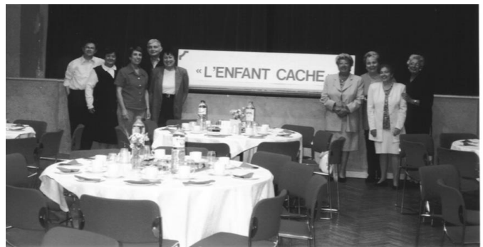
L'équipe dévouée des membres du Comité se prépare à accueillir les invités après la mise en place de la salle.

Ce jour-là, une tempête s'abattit sur Bruxelles, ce jour-là, le circuit des 20 kms de Bruxelles a barré maintes routes. Mais il fallait plus que cela pour décourager nos membres. Le café klatsch a réuni bon nombre de nos amis, ravis de se retrouver et de déguster les pâtisseries "maison" dans une ambiance "heimish" comme d'habitude.