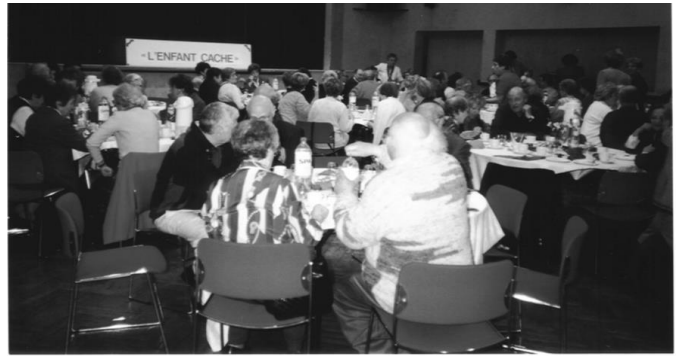
"Café Klatsch" du 28 mai 2000