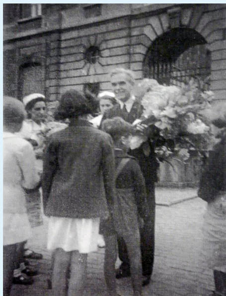
Le Prince de Ligne fleuri

ou par voie postale à Enfant Caché asbl , 68, avenue Ducpétiaux, B-1060 Bruxelles – Saint-Gilles