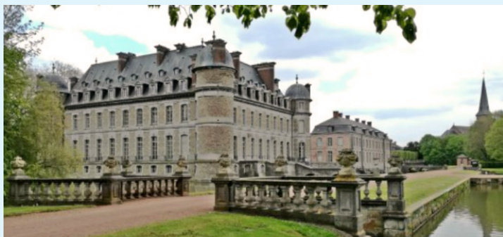
Château de Beloeil

Au château de Beloeil le 9 juillet 2023, de 13h30 à 18h30