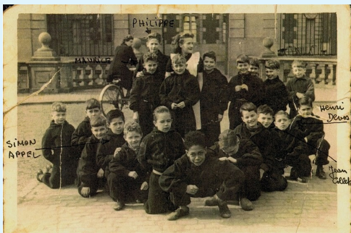
Beloeil. Groupe d'enfants dont 5 enfants juifs identifiés dans la cour principale, début 1943 (Documents Abraham Kapotka).